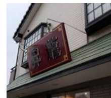
昇龍(中華料理) /500m(徒歩7分・車3分)