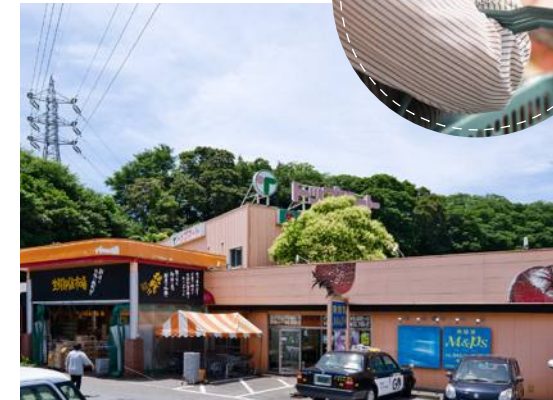
トップマート 都町店/1,000m(徒歩13分・車4分)

📍千葉県千葉市若葉区加曾利町998-1 ☎043-214-8178 🕒不定休 🕒9:00～22:00 🌐 https://www.gyomusuper.jp/shop/detail.php?sh_id=592