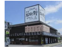
都町食堂 /1,100m(徒歩14分・車5分)

※徒歩での所要時間は、80m=1分での概算です。※車での所要時間は、実測です。交通状況によって異なります。※分数・距離はすべて現地からのものです。