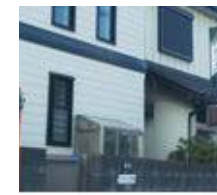
やぶ久(蕎麦) /600m(徒歩8分・車4分)