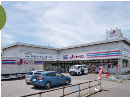
ジェーソン千葉都町店/650m(徒歩9分・車3分)

食料品、お酒、生活用品などを取り扱っていて商品の価格も安く幅広く揃っているのもまとめ買いに便利です。