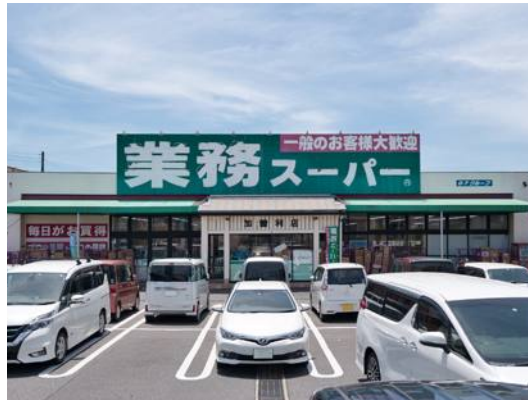
業務スーパー加曾利店/850m(徒歩11分・車3分)

📍千葉県千葉市中央区都町5-8-15 ☎043-235-3581 🕒不定休 🕒10:00～22:00 🌐 https://jason.co.jp/店舗詳細-千葉都町店/