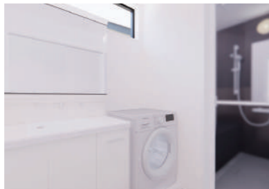
洗面・お風呂・トイレは1階に(Plan2)