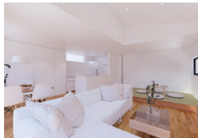
勾配天井のリビングは平屋ならではの(Plan3)