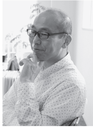
拓匠開発 建築事業部 部長 一級建築士